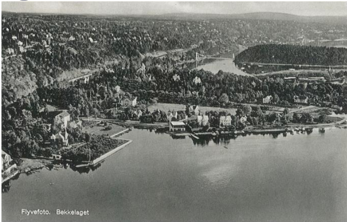
Flyfoto fra 1930-1940

Området rundt Ormsundkaia har store kvaliteter som bo- og rekreasjonsområde. Det nye Bekkelagsbadet med tilhørende park er blitt et populært utfluktsmål for store deler av byen. Ormsundkaia har kort avstand til alt; kollektivtrafikk på Mosseveien, teknisk infrastruktur, skole, barnehage, flotte rekreasjonsområder på land og vann og ny sykkelvei inn til byen. Det er for galt hvis disse arealene skal forbli stengt bak et gjerde med Oslo Havns klamme hånd på den ene siden av halvøya som på alle måter skaper et unaturlig skille mellom havn og by.